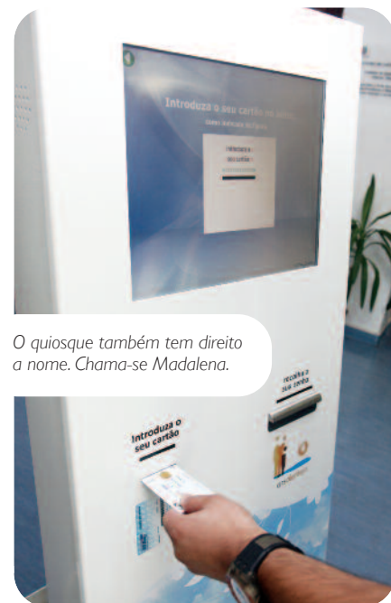
O quiosque também tem direito ao nome. Chama-se Madalena.