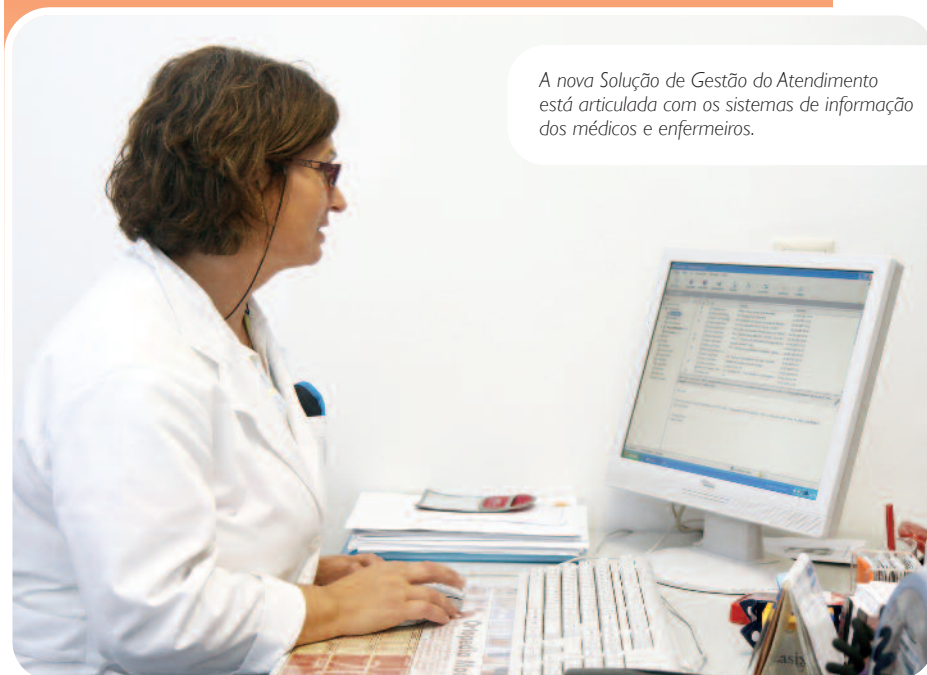
A nova Solução de Gestão do Atendimento está articulada com os sistemas de informação dos médicos e enfermeiros.